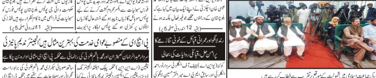
صوبائی وزیر زراعت نے چمن دھماکے کے خلاف 24 ستمبر کو جرگہ طلب کر لیا گیا۔

صوبائی صدر اے این پی کی چمن دھماکے کی مذمت، اسٹن اور افغان کڈواں کی بے دخلی کے خلاف 24 ستمبر کو جرگہ طلب کر لیا گیا۔ چمن دھماکے کے خلاف 24 ستمبر کو جرگہ طلب کر لیا گیا۔ صوبائی وزیر زراعت نے چمن دھماکے کی شدید الفاظ میں مذمت کی ہے۔