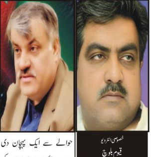
خصوصی اندرون قیوم بلوچ

جواب: غیر بخشنا اور اس پر اس دامان کی اجازت حاصل بلوچستان کے وزیر خزانہ، میر نورانی، اور حکومت کے لیے پانچ ماہ کی اجازت حاصل کرنا ضروری ہے۔